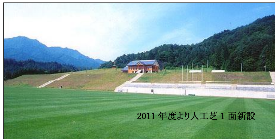
2011年度より人工芝1面新設